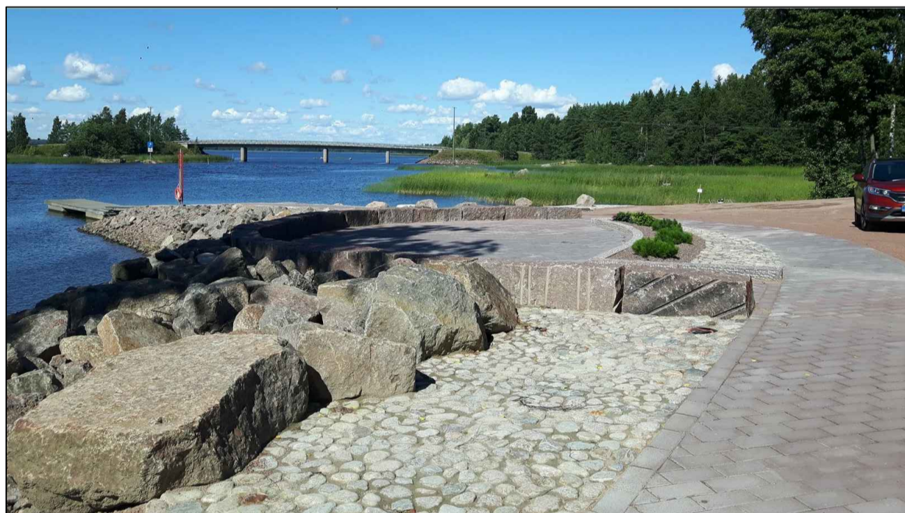
ranta-alueen kiveystä ja ympyräideaa. Isommat luonnonkivet asetellaan huolella, joten toimivat myös istuimina. Ideakuva: Azalea maisemasuunnittelu Kairi Meos