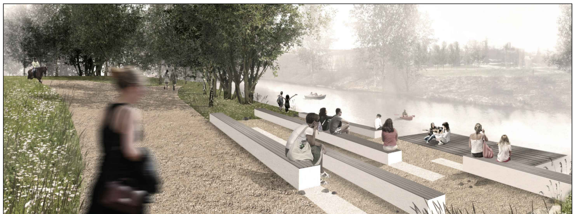
maastoportaita useassa paikassa. Portaat tehdään porakivillä. Rannan tuntumassa ei pinnan suojausta. Vanhan katsomon kohdalla porakivien päälle asennetaan puukansi. Ideakuva Loci maisema-arkkitehdit