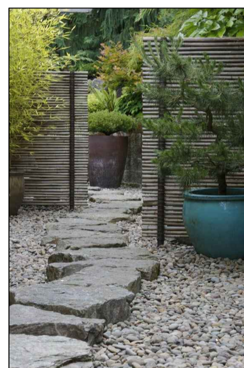
askelkivi kulkua rantakiveyksellä